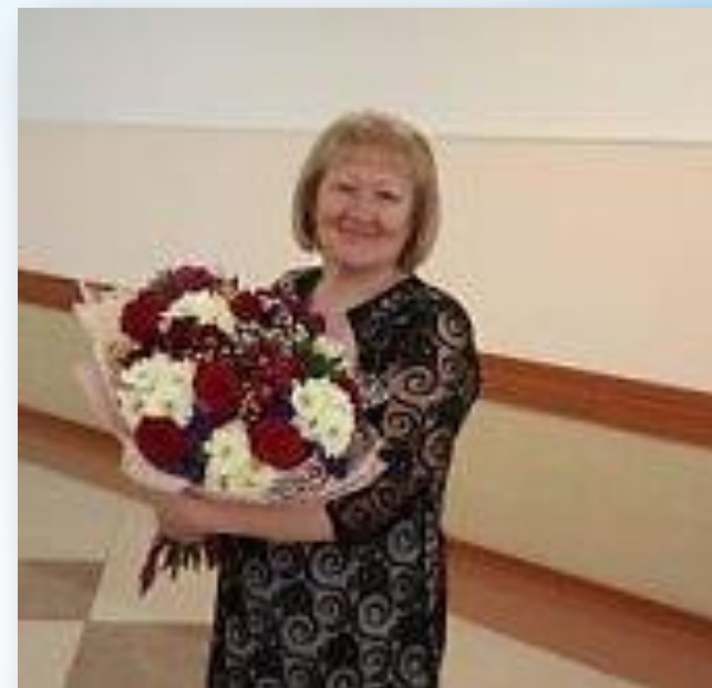
Руководитель БУ «КЦСОН Тюкалинского района»

На протяжении нескольких лет БУ «КЦСОН Тюкалинского района» плодотворно сотрудничает с Тюкалинским районным Советом ветеранов. Наше сотрудничество осуществляется по нескольким направлениям: консультативно-разъяснительная работа; оказание содействия при подготовке мероприятий и акций, направленных на социальную поддержку ветеранов; оказание методической помощи при подготовке ветеранскими организациями конкурсных проектов; содействие в проведении торжественных мероприятий, посвященных памятным датам. Члены Совета ветеранов ежегодно входят в состав аттестационной комиссии и комиссии по оказанию материальной помощи гражданам, находящимся в трудной жизненной ситуации. С 2016 года организуется совместная работа по созданию проектов на средства областного субсидирования. Так, в 2016 году был создан проект «Скандинавская ходьба как средство повышения качества жизни пожилых людей», а в 2018 году проект «Гончарное дело – прошлое и настоящее».