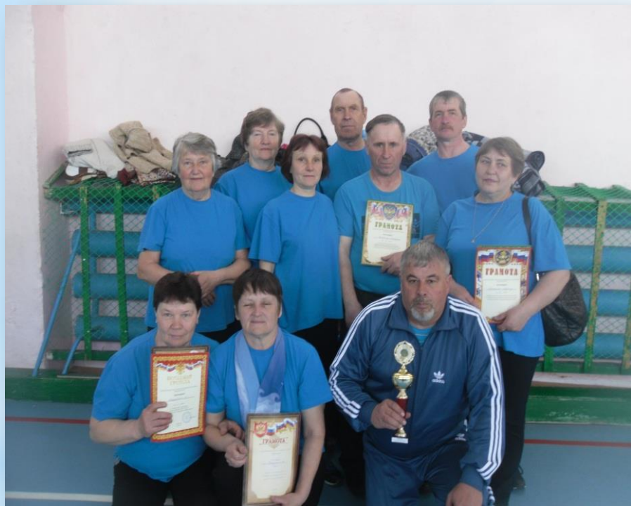
Победителями стали - ветераны Кабырдакского сельского поселения

Пятый год в нашем районе проводится спартакиада ветеранских организаций «За здоровый образ жизни». В 2018 году приняли участие 11 команд - 3 городских и 8 сельских поселений.